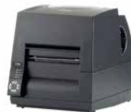
Impressoras de Etiqueta Térmica