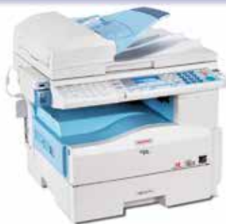
Sistema de Impressão